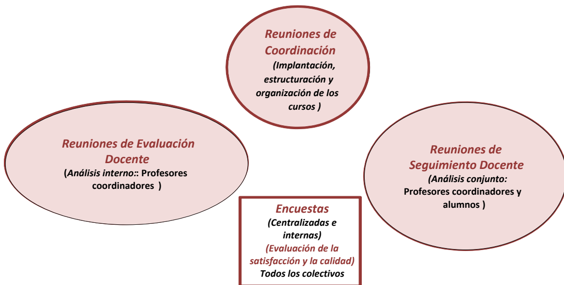
EV1.4. Figura 3. Sistema de coordinación, evaluación y seguimiento docente